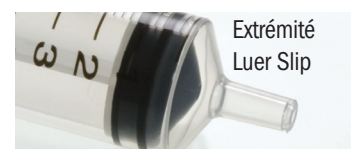
Extrémité Luer Slip