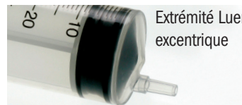
Extrémité Luer excentrique