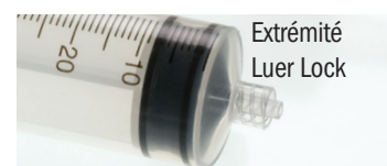
Extrémité Luer Lock